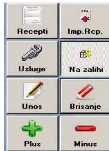
Slika 3: Opcije pregleda artikala i unosa u stavke računa

Napomena: Ukoliko je odabrana neka od prethodno pobrojanih opcija, na ekranu će se ta ikona prikazivati kao osvijetljena. (Primjer: na slici 3 ikona Na zalihi).