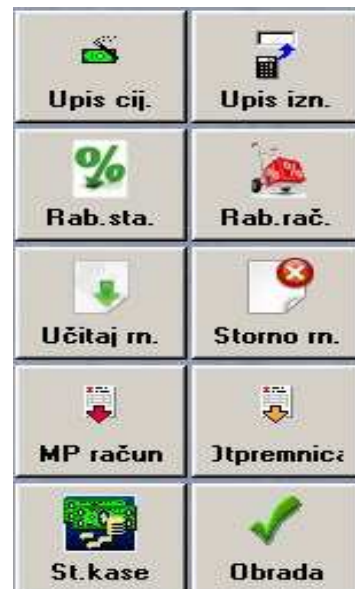
Slika 5: Opcije obrade POS stavki i računa

- St. Kase (Ctrl+Alt+S) - nudi pregled stanja kase i šalje naredbu za štampanje presjeka stanja na fiskalnom printeru. Novost se odnosi na slučajeve kada se radi na više kasa. Na novoj verziji aplikacije dodana je mogućnost pregleda ukupnog prometa (za sve kase u sistemu).